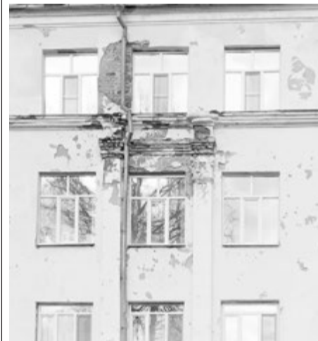
Школа №29: разрушенный фасад