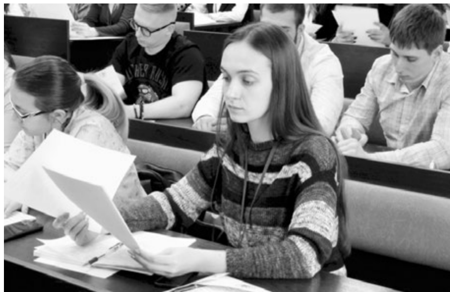
Молодежь получила пищу для размышлений